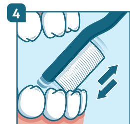
4 Dents de devant : placer la brosse verticalement en allant toujours de la gencive vers la dent.